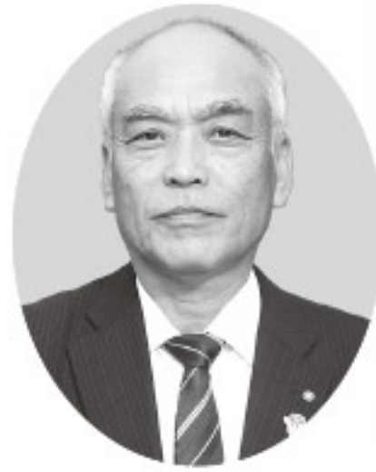
里庄町長 大内恒章