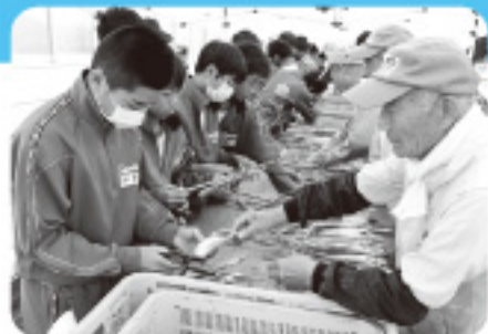
10月17日 まこもたけ出荷作業体験