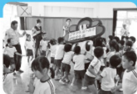
9月27日 幼児交通安全教室