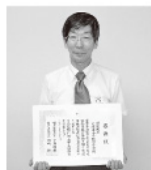
里庄東小学校児童会