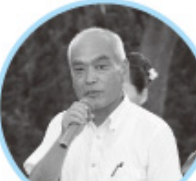
大内町長あいさつ