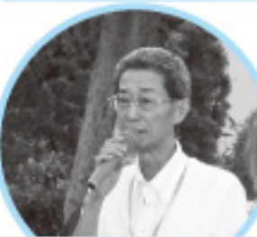
松原議長あいさつ