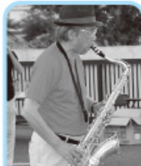
永廣施設長による生演奏