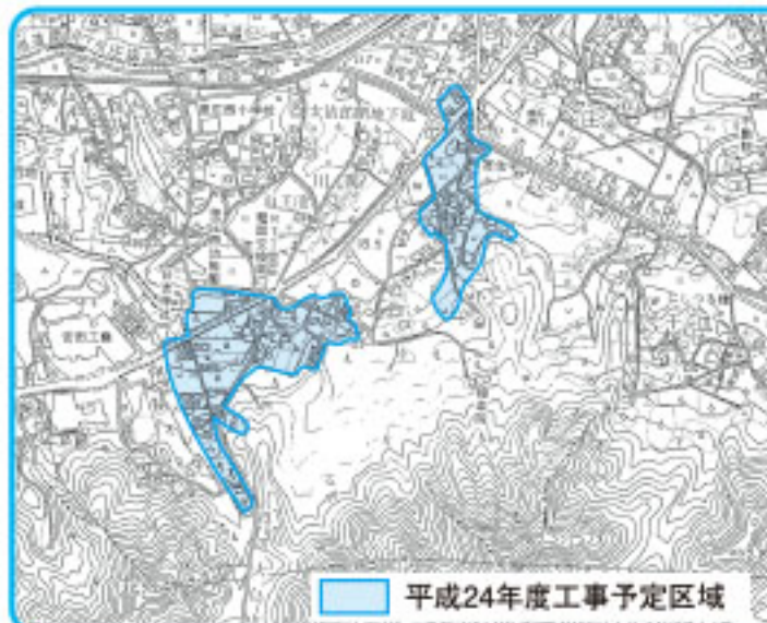
平成24年度工事予定区域

これまでのご功績に対しまして、心からの敬意と感謝を申し上げますとともに、今後ますますのご活躍をお祈りいたします。