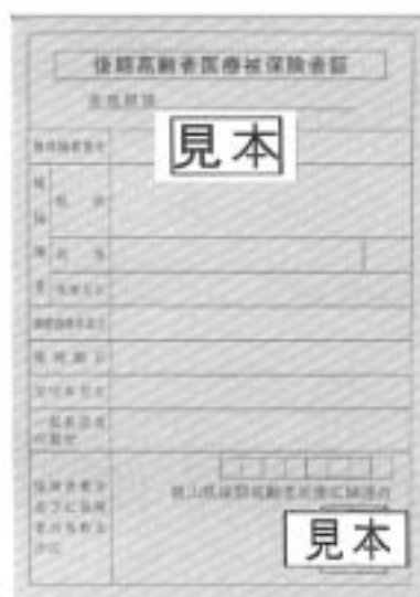
※新しい被保険者証は水色です。