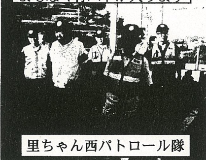
里ちゃん西パトロール隊