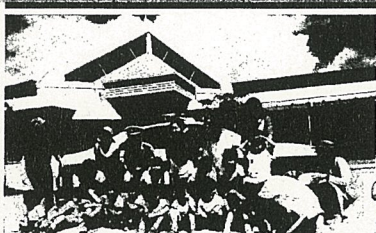
里庄西幼稚園の子供達