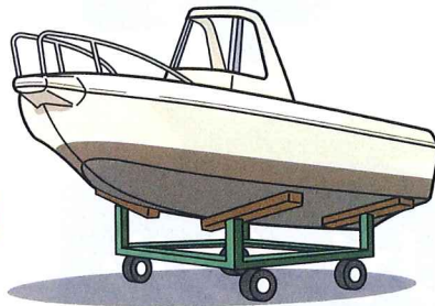
③その他（一時保管、下架料金等）