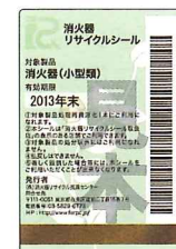
既製品用シール(見本)