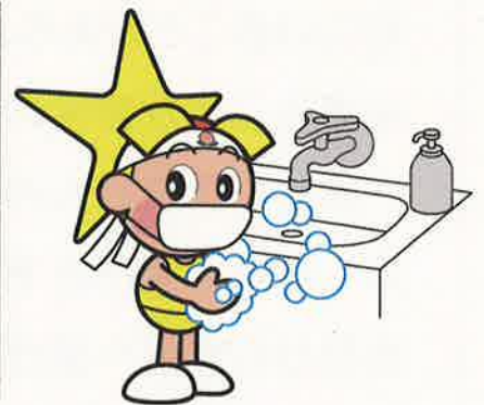
「岡山県マスコット ももっち」