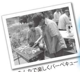
みんなで楽しくバーベキュー