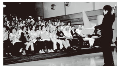
6月20日社協サロンの様子