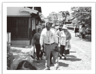
1日研修旅行(美観地区)