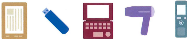
電子書籍端末 USBメモリ 電子辞書 ヘアドライヤー ICレコーダ