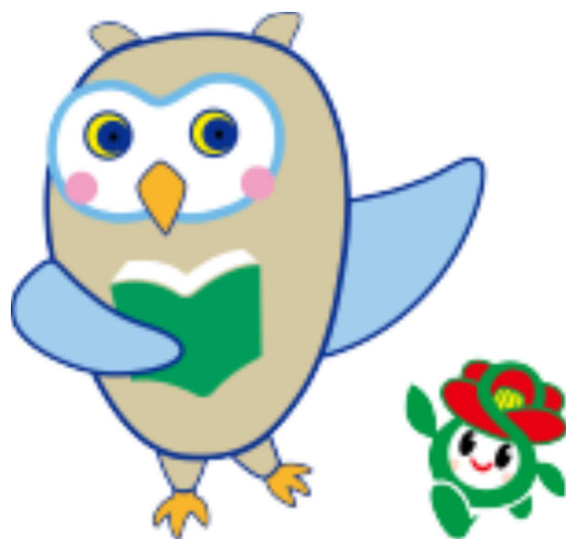
ふくちゃん & 里ちゃん

里庄町立図書館ニュース No. 312 2019. 5. 1 岡山県漢口郡里庄町里見2621 電話 0865-64-6016