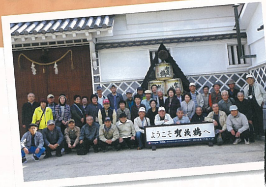
東広島市内に於いて

1円から500円までの6種類すべての硬貨は、広島で製造していることに驚きました。