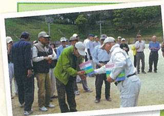
つばきの丘 グラウンドに於いて