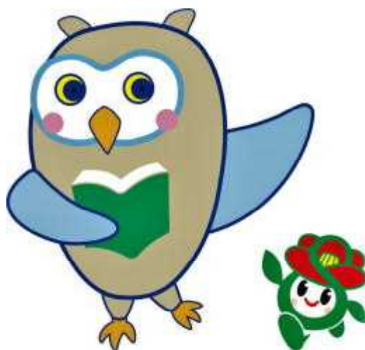
里庄町立図書館キャラクター 里庄町キャラクター ふくちゃん & 里ちゃん

里庄町立図書館ニュース No. 321 2020. 2. 1 岡山県漢口郡里庄町里見2621 電話 0865-64-6016