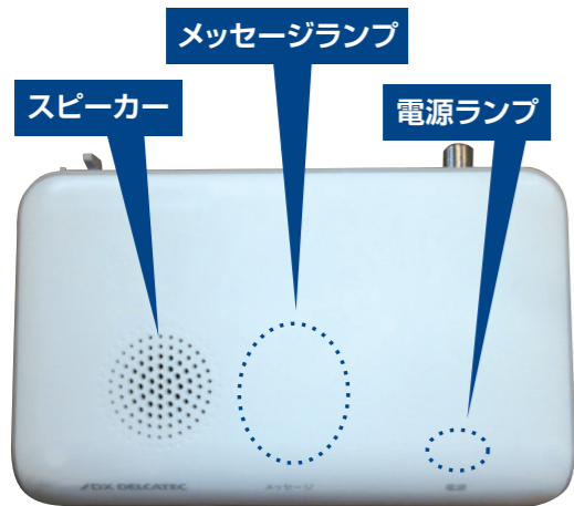
設置する戸別受信機

笠岡放送の光ファイバーを活用し、戸別受信機と戸別受信機に接続されたテレビに情報を配信。(ゆめネット光テレビに加入していなくても設置可能)