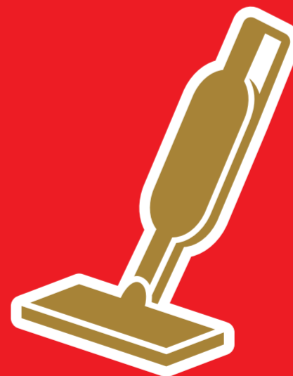
ハンディクリーナー