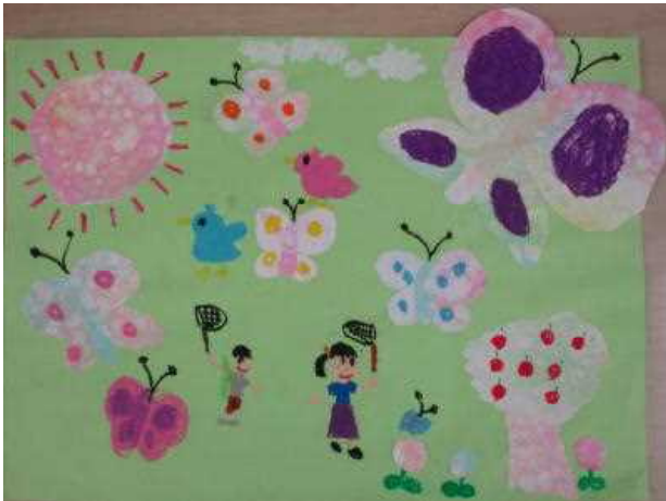
「大きなちょうを見つけたよ」 とくなが 花