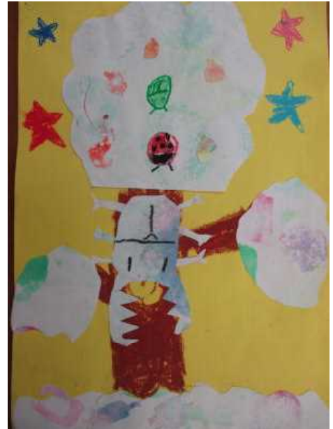
「サンダーワールドの虫」 ふじわら し月