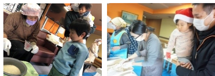
（写真は12/24に開催した「もち丸め会」の様子です）

お楽しみ会・お誕生日会・講習会・ママのリフレッシュ・親子ヨガ・リトミックなどの楽しいイベントも毎月開催しています！気軽にぜひ遊びに来てくださいね。