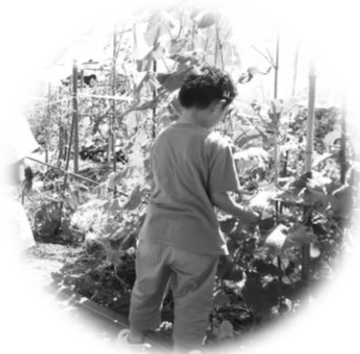
ぽかぽかファームでの 野菜の収穫♪