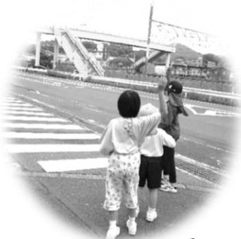
交通マナーの学習