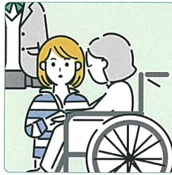
障害や病気のあるきょうだいの世話や見守りをしている。