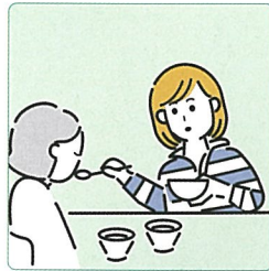
障害や病気のある家族の身の回りの世話をしている。