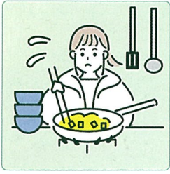
障害や病気のある家族に代わり、買い物・料理・掃除・洗濯などの家事をしている。

本来大人が担うと想定されている家事や家族の世話を日常的に行っていること。責任や負担の重さにより、学業や友人関係などに影響が出てしまうことがあります。