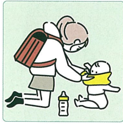
家族に代わり、幼いきょうだいの世話をしている。