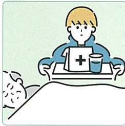
がん・難病・精神疾患など慢性的な病気の家族の看病をしている。