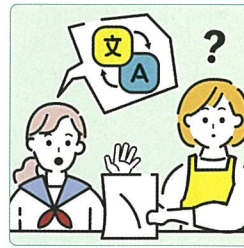
日本語が第一言語でない家族や障害のある家族のために通訳をしている。