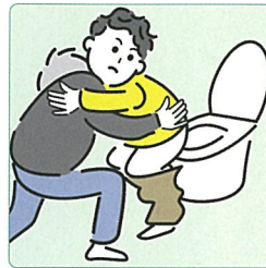
障害や病気のある家族の入浴やトイレの介助をしている。

ヤングケアラーは、家事や家族の世話をがんばっているからこそ、こんな気持ちを持っているかもしれません。