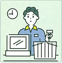
家計を支えるために労働をして、障害や病気のある家族を助けている。