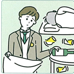
アルコール・薬物・ギャンブル問題を抱える家族に対応している。