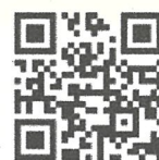
つうえんポータル

つうえんポータルが使用できない方は書面での申請も可能です。健康福祉課までお問合せください。