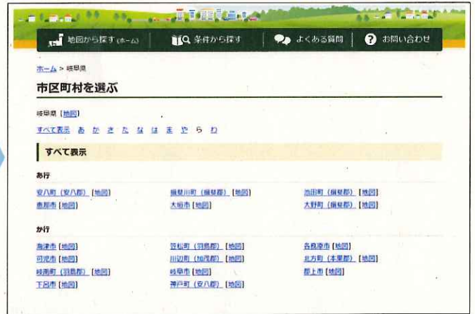
都道府県→市町村(字)の地図から検索できます。