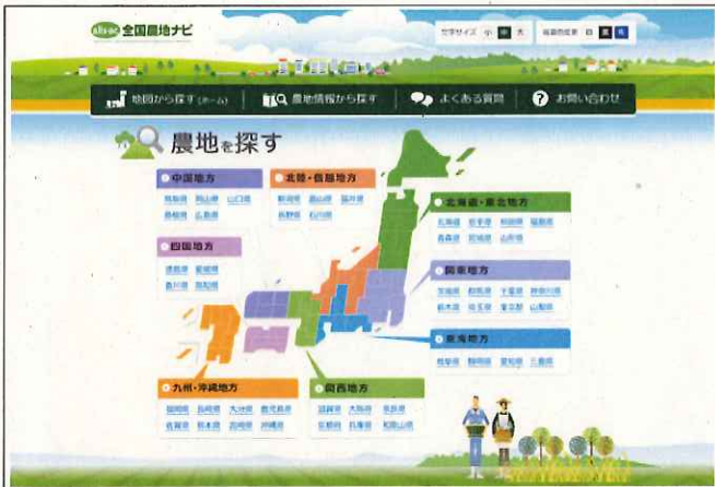
全国農地ナビのトップ画面

インターネットの利用による農地情報の公表では、農地の所有者や利用権などを設定されている耕作者の名前は公表されません。公表する情報は、一筆ごとに表示され、農地地図と一体的に見られます。