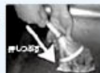
ペットボトルの飲み口を再利用