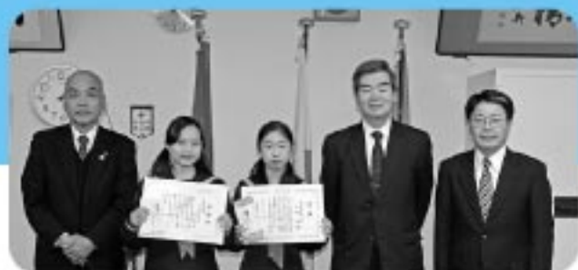
12月12日 中学生の「税についての作文」表彰式