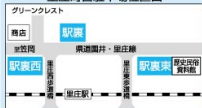
里庄町営駐車場位置図