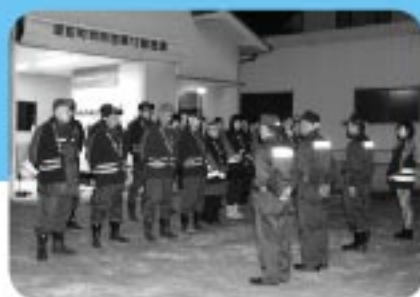
12月30日 里庄町消防団年末夜警