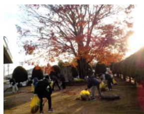
【第2回総合講座】 清掃奉仕作業 里庄町中央公民館前の 駐車場・通路周辺を清 掃活動