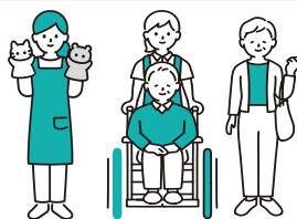
社会福祉法人 など